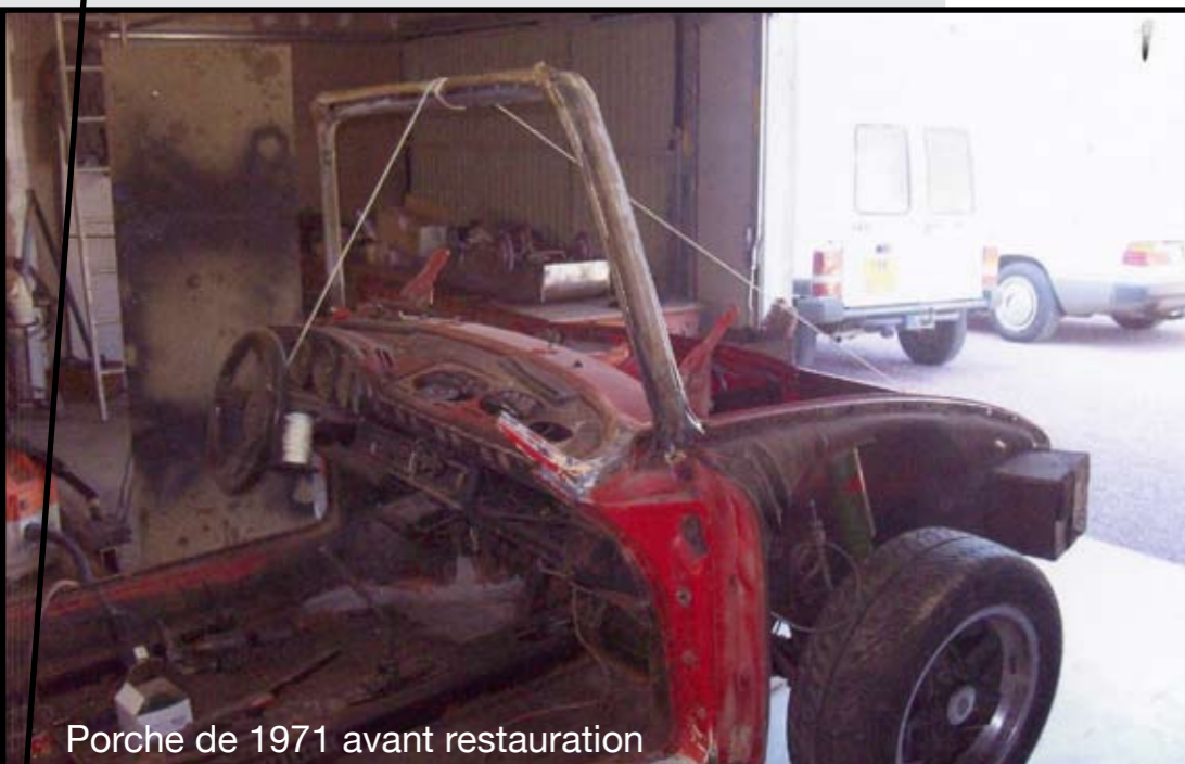
Porche de 1971 avant restauration

Plus de 40 années de passion pour ne pas oublier le bonheur qu'elles lui ont connu. Des ancêtres aux contemporaines, en passant par les sportives, il ne parle que de ces élégantes machines qui nous transportent dans le temps et qui n'ont pas fini de nous faire rêver.