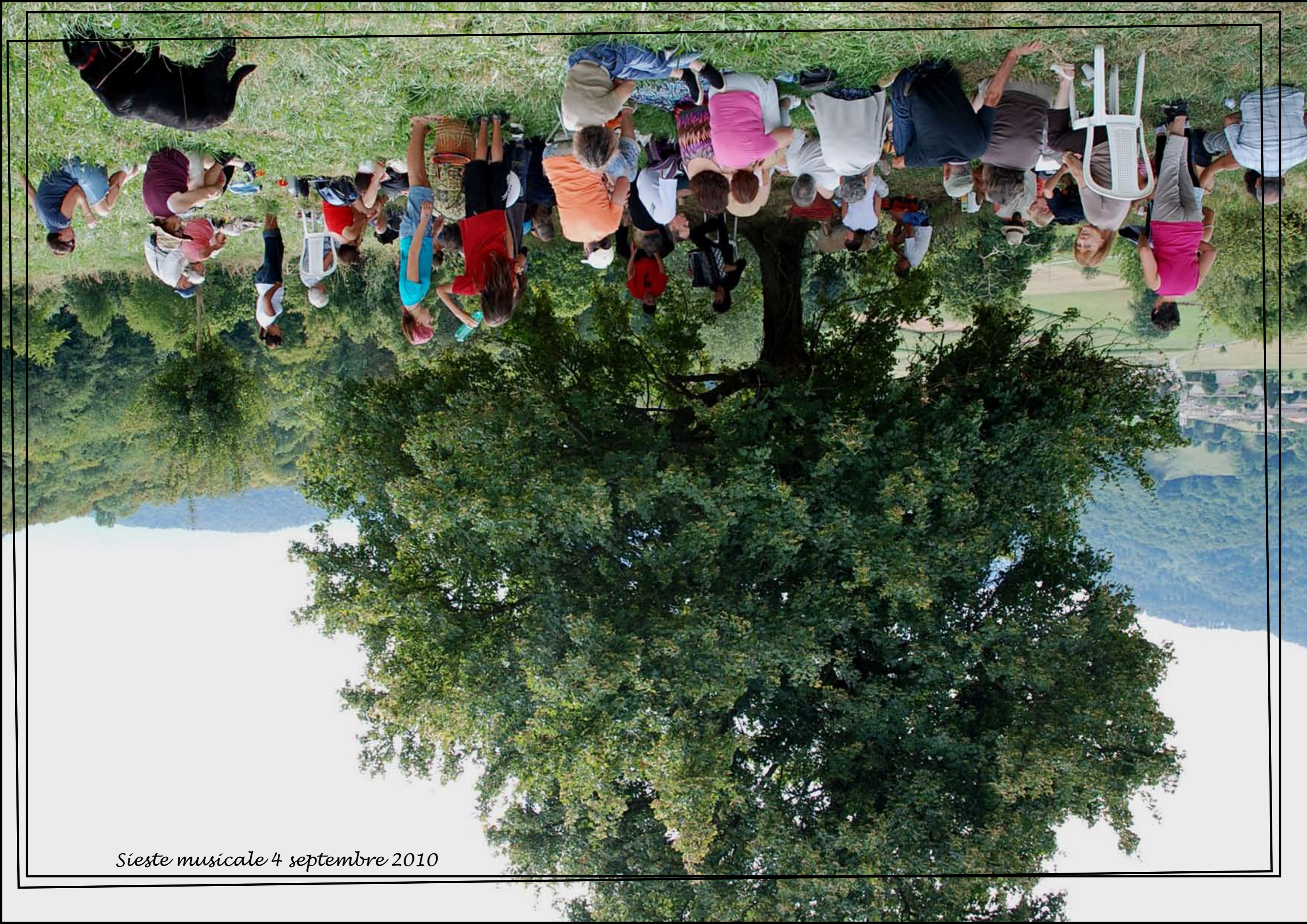
Sieste musicale 4 septembre 2010