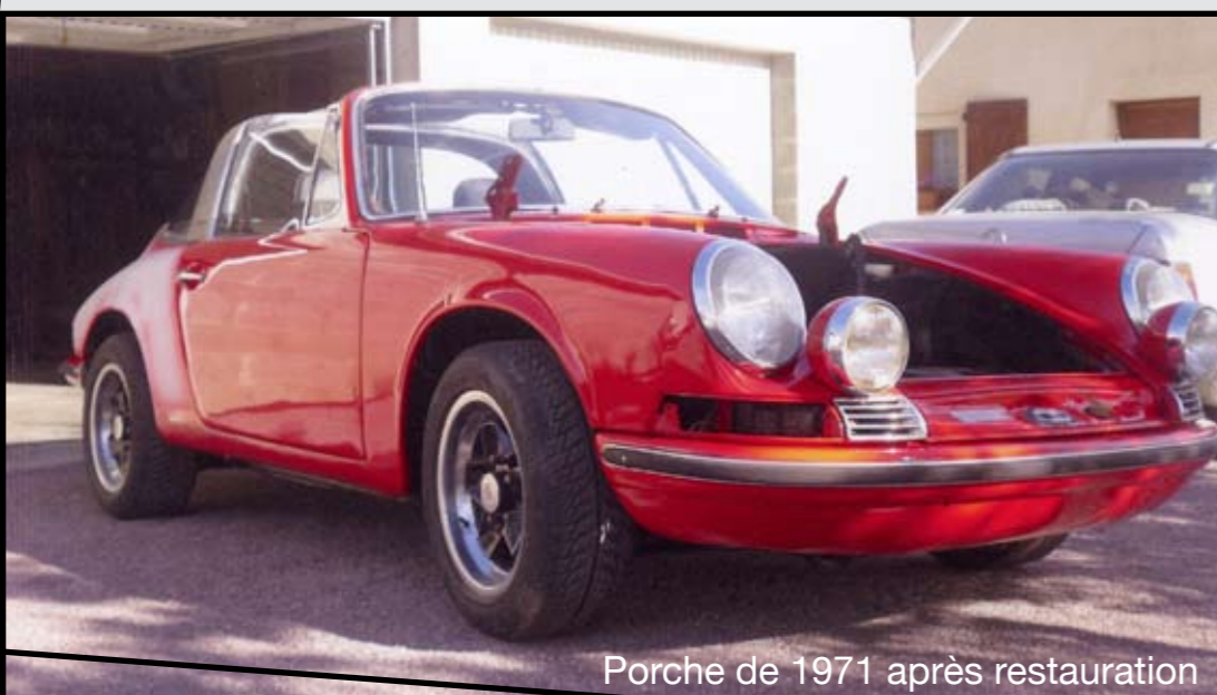
Porche de 1971 après restauration

Maintenant formateur en carrosserie, Jean-Paul continue toujours de restaurer, de peindre et faute de place il collectionne surtout les miniatures avec un peu plus de 3000 véhicules.