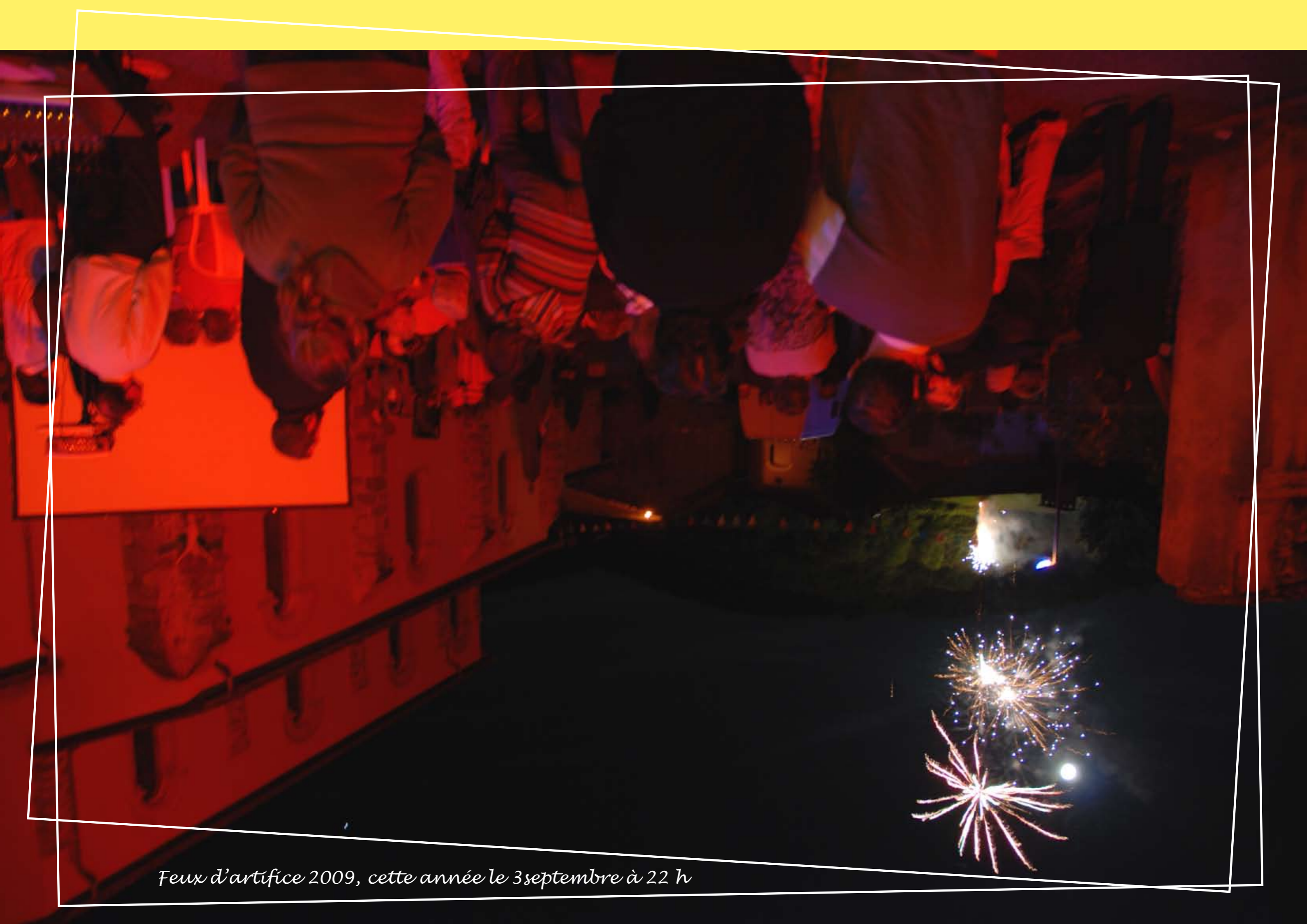
Feux d'artifice 2009, cette année le 3 septembre à 22 h